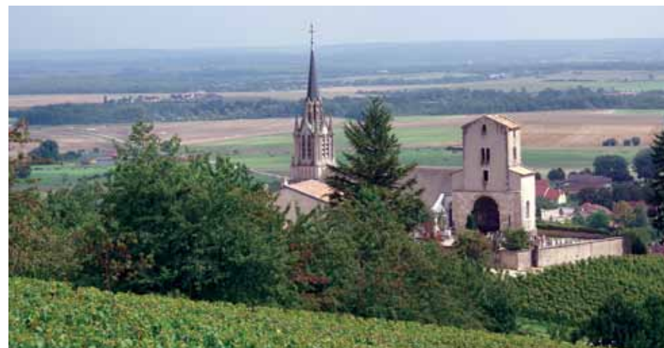
L'église de Bruley.