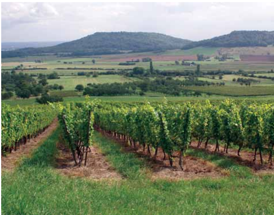
Vignoble du Toulois.

Rejoignez-nous et randonnez l'esprit libre