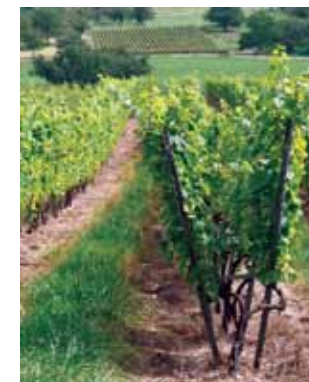
Vignes du Toulois.